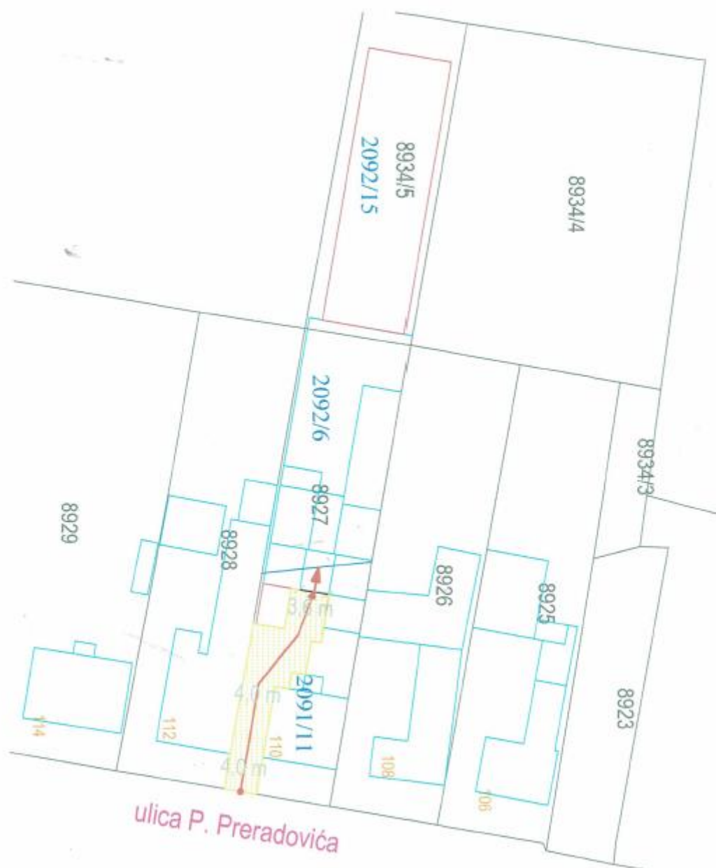
Skica s prikazom prolaza M 1 : 500